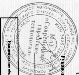
График полива зеленых насаждений из поливочного водопровода на июнь 2024 года (деревья, кустарник)